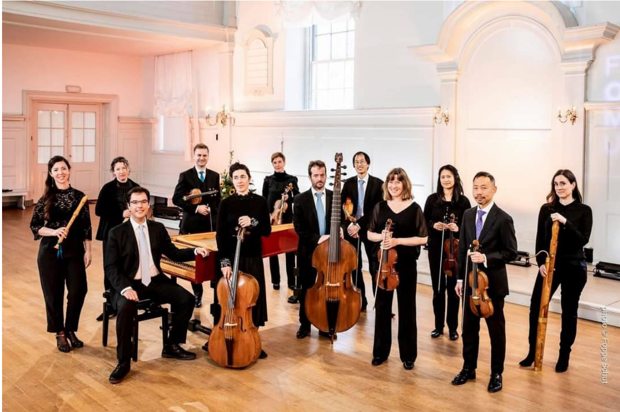
New Collegium